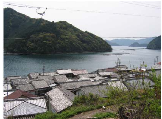
須賀利湾を見下ろす美しい家並み