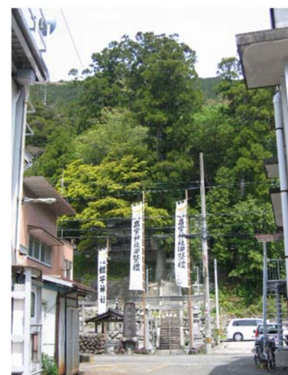
高宮神社の境内と社