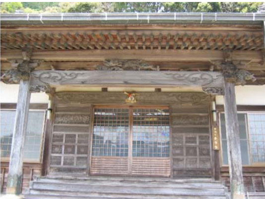
普濟寺の本堂（美しい透かし彫り）