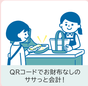
QRコードでお財布なしの ササッと会計！