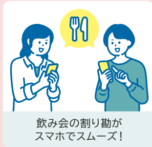
飲み会の割り勘が スマホでスムーズ！