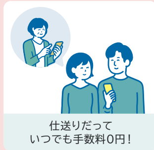
仕送りだって いつでも手数料0円！