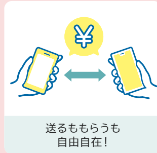
送るももらうも 自由自在！