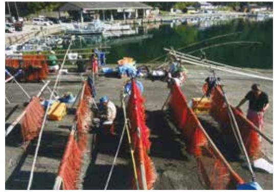
平成 26 年度四季の尾鷲フォトコンテスト冬部門最優秀賞作品「エビ網漁の人達」