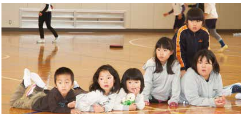
おわせ海・山ツアーウォーク