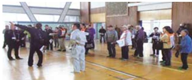
避難所の現地確認