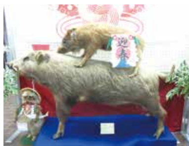
中央公民館で展示したイノシシの剥製

遺跡の発掘調査によると、日本人とイノシシのかわりは、すでに縄文時代からあったようです。縄文人は、主に狩猟によって食料を得ており、イノシシを狩って食べていたと考えら