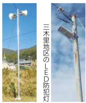
三木里地区のLED防犯灯