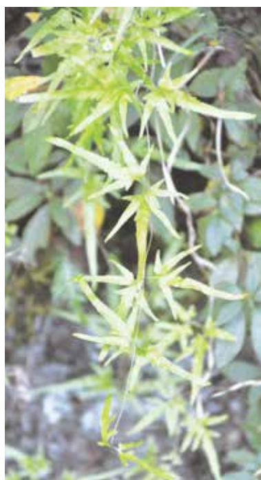
カニクサのつる(中軸)と羽片

とは違う変わったところを アサガオのつるは茎ですもっています。それは他のが、カニクサのそれは茎では植物に巻きついてつるにならず、葉の一部(中軸という)という特徴です。つるは2mほどまで伸び、条件がよければもっと伸び続けます。このつるで子ども達がカニを釣ったことから「カニクサ」の名前がつけました。 成熟した株では、つるの上部に胞子をつけた、ちぢれた羽片がみられます。この胞子物では茎は地下(地下茎と呼ばれている)にあり、地上に、利尿、解熱等の薬草としては葉だけが出ています。カニで利用されたりします。