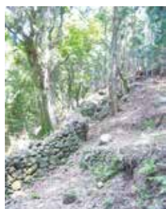
曾根次郎・太郎坂のシシ垣

江戸時代に入ると、再びイノシシの狩猟や肉食がみられます。江戸では「ももんじ屋」（獣肉店）というお店で野生のイノシシを「ぼたん」「山鯨」と称して販売していたようです。しかし、山間地域などでは「シシ垣」を造るなどして、イノシシなどによる農作物への被害対策が取られるようになり