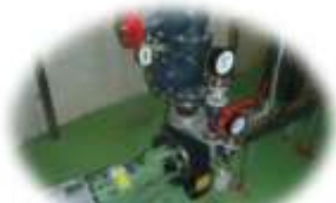
魚市場向け送水ポンプ 分水施設