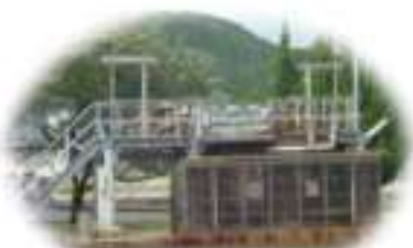
大口分水【活魚車向け】