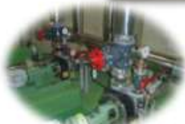
総合・LDC送水ポンプ