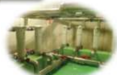
バックフィルター