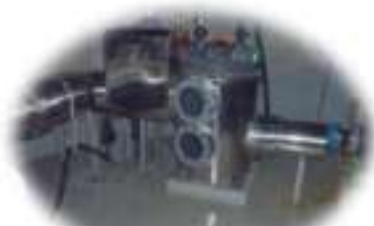
取水ストレーナー