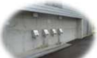
中口分水【業者向け】