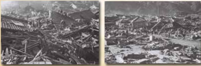
昭和東南海地震・津波による尾鷲市の惨状

三重県下において死者373人、負傷者607人、流失家屋2,238棟、住宅全壊3,376棟もの被害を及ぼしたこの地震・津波は、本市においても65人の死者と818棟の建物被害をもたらしました。