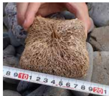
↑ 須賀利大池の浜辺に漂着したゴバンノアシの果実

須賀利大池の浜辺に漂着したゴバンノアシの果実は、漂流期間が長かったためか、皮がはがれ中の繊維質の部分がむき出しになっていました。石垣島よりはるか南の熱帯の島から黒潮に乗り、何カ月もの航海を経て尾鷲の浜に漂着したのかもしれない。海辺に生育する植物たちは、ゴバンノアシのように水に浮くための巧みな工夫を凝らして、より遠くへ新天地を求めて旅をしています。