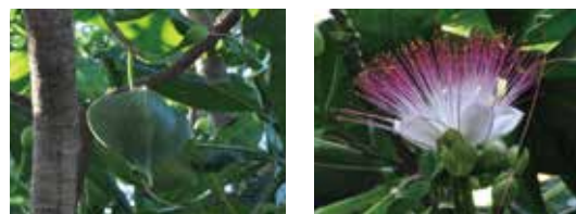
↑ 西表島で見たゴバンノアシの果実と花 (2019年10月撮影)