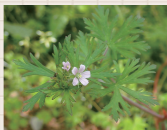
▲アメリカフウロの花 (花の直径約8mm)

野菜がしおれて枯れてしまう青枯病という病気がありますが、この病原菌に対してアメリカフウロに含まれている成分に抗菌作用があることが近年わかってきました。今後、青枯病防除対策の一つとしてアメリカフウロの利用が期待されています。