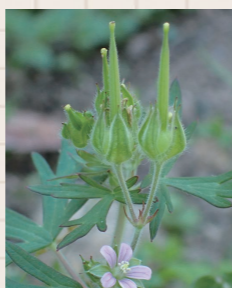
▲アメリカフウロの果実 (細長く伸びた果実の付け根に5個の種子ができる)