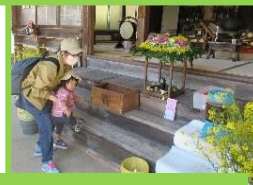
花まつりに行ってきました